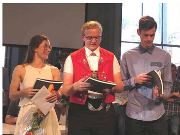
LOK St. Gallen

Mehr Mitglieder heisst für uns, dass das Engagement für die Veranstaltungen der QV-Feiern in Buchs und in der LOK St. Gallen, wenn auch immer noch mit einem Verlust, etwas besser finanziert werden kann.