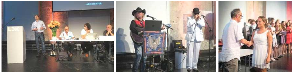
SG LOK 2017

An der QV-Feier vom Donnerstag 6.7.2017 in St. Gallen durften wir als Festredner Kay Kröger engagieren. Der musikalische Beitrag kam von der Country und Blues Gruppe Highway Strings. Dieses Jahr erschienen wir sogar im Tagblatt, Fotograf: Benjamin Manser. Anzahl Teilnehmer ca. 260 Personen. Es wurde erneut der geschätzte Zusatzpreis des Architekturforum Ostschweiz übergeben, dieses Jahr mit dem prämierten Buch a-f-o Gutes Bauen an die 3 besten Absolventen inklusive einer online-Jahresmitgliedschaft. Ausklang im Hof der Lokremise bei Kornhausbräu und Bechinger Bratwurst.