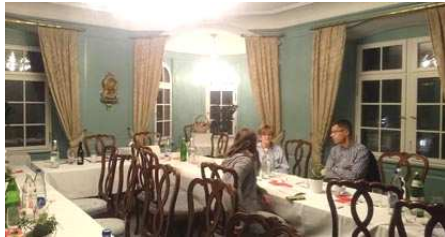
Rokokosaal, nach der 38. HV Schlössli St. Gallen