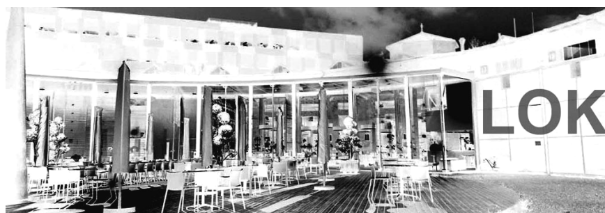
Stimmungsbild QV-Feier St. Gallen (bevor die Festteilnehmer eingetroffen sind ;-)

PS: Dieses Dokument findet man unter downloads auf unserer Homepage, kurz vor der aktuellen Hauptversammlung. www.bvza-sal.ch