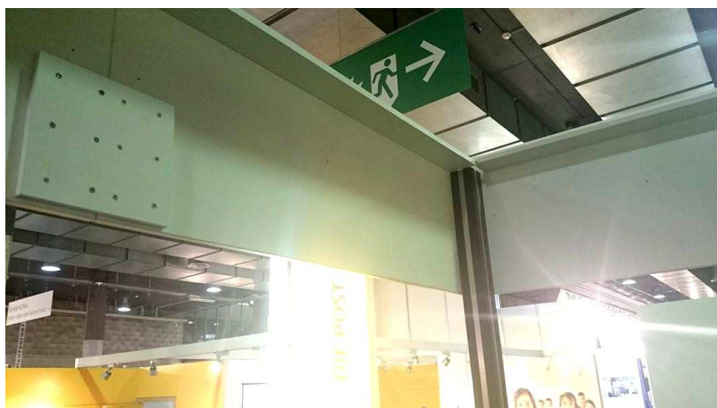
Statik und Befestigungen Schriftband