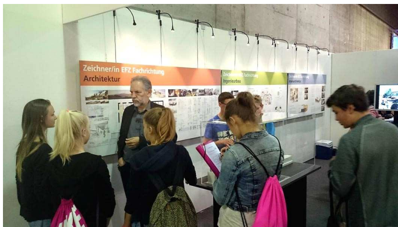
Neues Design Beleuchtung